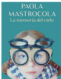
Paola Mastrocola/ La memoria del cielo/ Rizzoli/ pp 272/ euro 19,00.

felice. Mastrocola da voce al difficile rapporto tra Nord e Sud e al contrasto tra l'universo sfavillante delle signore che si misurano in sartoria i vestiti e quello modesto della propria famiglia che sogna una casa di proprietà.