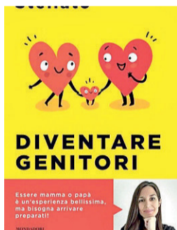
Diventare genitori/Camilla Stellato/ Mondadori/ 160 pagine/ 18 euro

fare chiarezza sulle implicazioni che la genitorialità porta nella vita di un adulto, aiutando a considerare normali alcune situazioni e invitando ad affrontare le difficoltà quando si presentano.