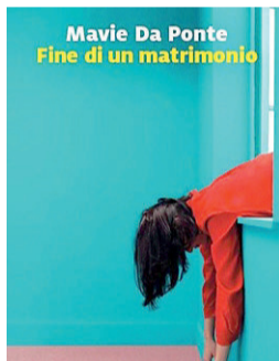
Mavie Da Ponte/ Fine di un matrimonio Marsilio/ pp. 400/ euro 19,00

Innamorarsi, in fondo, è più semplice che tenere in piedi un matrimonio o una relazione, ricominciare è meno faticoso che provare a riparare: questo racconta, a ogni riga, l'esordio di Mavie Da Ponte